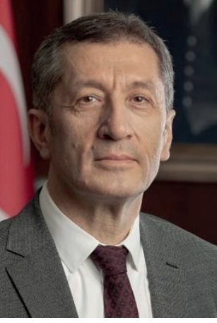
Ziya Selçuk Millî Eğitim Bakanı